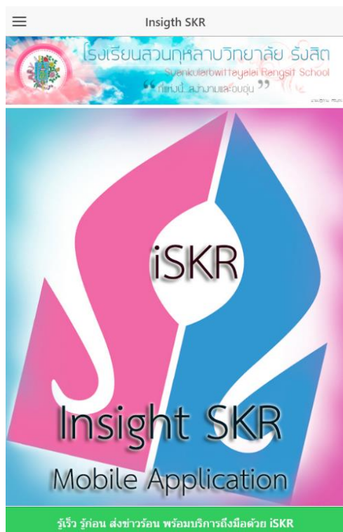
รูปที่ 8 หน้าแรกของแอปพลิเคชัน