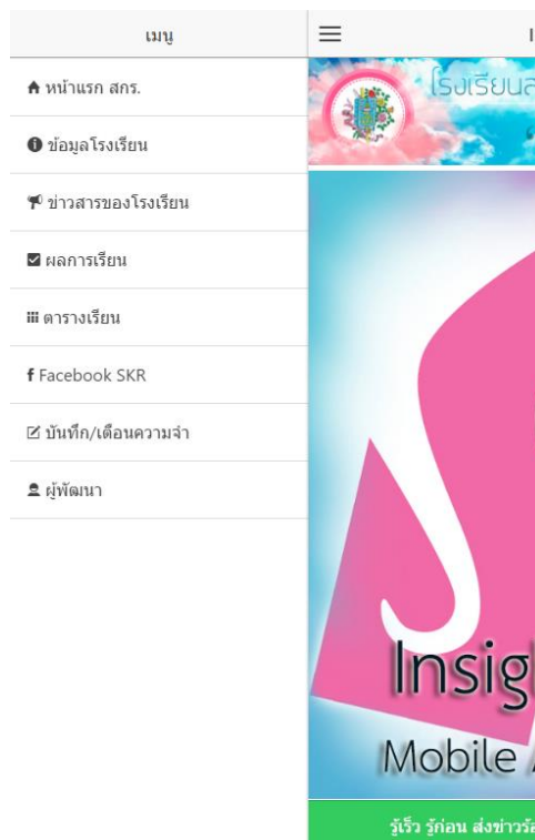
รูปที่ 9 หน้าเมนูของแอปพลิเคชัน