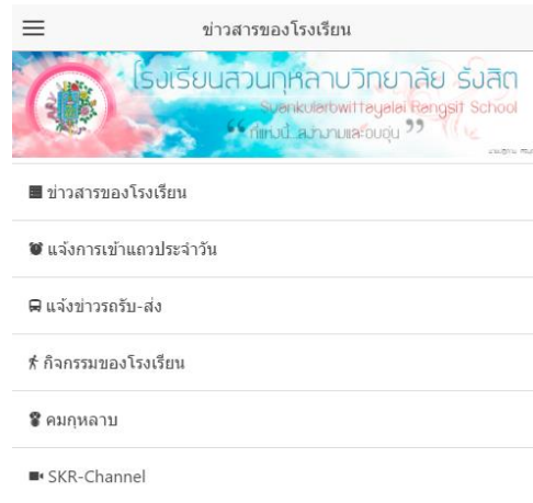
รูปที่ 11 หน้าเมนูแสดงข่าวประเภทต่างๆ