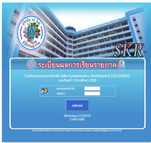
รูปที่ 14 หน้าต่างสำหรับดูผลการเรียน