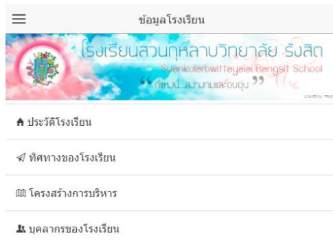
รูปที่ 10 เมนูข้อมูลโรงเรียน